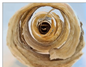
Bildet viser fiskeskinn fra tørrfisk. Produktet er interessant som råstoff til ekstraksjon av kollagen.

Torskeskinn er et etterspurt råstoff for ekstraksjon av marint kollagen. Ved produksjon av enkelte lutede og utvannede tørrfiskprodukter, tas skinnen av. Dette er semitørt og et relevant råstoff for produksjon av marint kollagen.