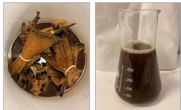
Bildet viser utvannet tørrfisk som råstoff for fiskesaus.

I motsetning til tørt restråstoff, har en del av det våte restråstoffet kort holdbarhet. I prosjektet ble råstoffet benyttet til en prøveproduksjon av fiskesaus, med gode resultater.